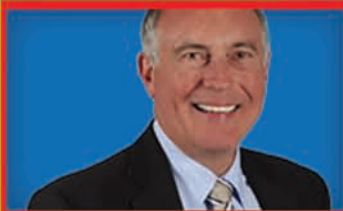
Warren Truss Deputy PM, Infrastructure and Regional Development

Nationals leaders has represented the seat of Wide Bay in southern Queensland since 1990. Is known for being quietly spoken and shunning the limelight. Was Minister for Trade in the Howard Government.