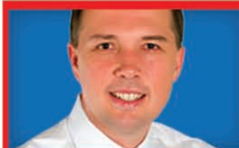
Peter Dutton Health, Sport

Has been the member for Wentworth since 2004. Was deposed as Liberal Leader by Tony Abbott by a single vote in 2009. Had a successful life before entering politics, working as a journalist and a lawyer before becoming a businessman.