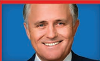
Malcolm Turnbull Communications

Has been the member for Menzies in Victoria in 1991. Held a number of ministries in the Howard Government. Has five children and describes himself as an avid cyclist.