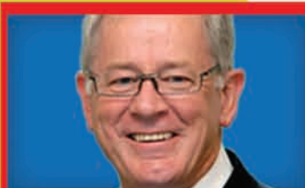
Andrew Robb Trade, Investment

Became the member for Dunkley in Victoria in 1996. Served in Defence portfolios in the Howard Government.