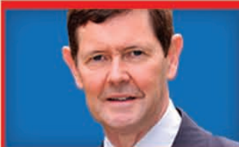
Kevin Andrews Social Services

Has held the seat of Groom, in southern Queensland, since 1998. Served as a minister in the Howard Government.