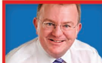
Bruce Billson Small Business

Became the member for Dickson in Brisbane's north in 2001, defeating Cheryl Kernot. Served as Minister for Revenue and Assistant Treasurer in the Howard Government. Was a police officer before entering parliament and is the father to three young children.