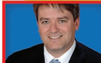
Mathias Cormann Finance

Was the MD of Tourism Australia before becoming the MP for Cook, in NSW, in 2007. Has had a high-profile during the Coalition's time in Opposition as the spokesman on immigration.