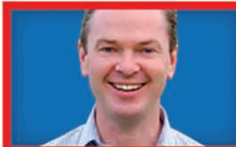
Christopher Pyne Education

Has led the Coalition since 1 December 2009. Was a senior member of the Howard Government. Has been member for Warringah, on Sydney's North Shore, since 1994.