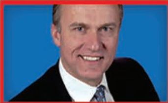
Eric Abetz Employment, Assisting the PM on the Public Service

WA-based MP for Curtin is the Deputy Liberal Party Leader. Was Minister for Education, Science and Training and Minister Assisting the Prime Minister on Women's Issues in the Howard Government.