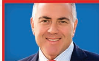
Joe Hockey - Treasurer

Was elected as a Senator for Queensland in 2002. Served as Minister for Arts and Sport in the Howard Government.