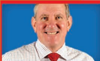
Ian Macfarlane Industry

NT Senator was the Minister for Community Services in the Howard Government. Was born in England, spent time in Malaysia and Africa but moved to the NT in 1985. Was deputy leader of Nationals in previous parliament.