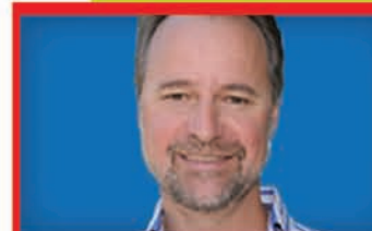
Nigel Scullion Indigenous Affairs

Has been the member for Sturt in South Australia for two decades, having been elected as a 25-year-old. Served as Minister for Ageing in the closing stages of the Howard Government. Has four children and is an AFL fan.