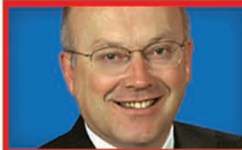
George Brandis Attorney-General, Arts

The Liberal Senator for Tasmania serves as the Coalition's Leader in the Senate. Held a number of ministries in the Howard Government. Was a lawyer before becoming a politician and was born in Germany.