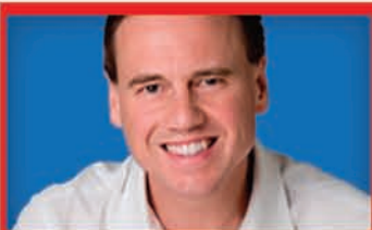
Greg Hunt Environment

Was elected as a Senator for WA in 2001. Was Minister for Justice and Customs in the final year of the Howard Government. Is a former lawyer, has worked in both Perth and Kalgoorlie and is a West Coast Eagles AFL fan.