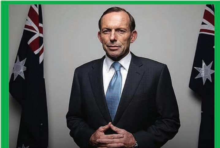
Tony Abbott - Prime Minister

Deputy leader of the Nationals. Has successfully moved from the Senate to win the seat of New England in NSW, vacated by Independent Tony Windsor. Ran his own accountancy firm in the western Queensland town of St George for a decade.