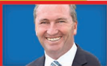
Barnaby Joyce Agriculture

Has been the member for North Sydney since 1996. Held a number of Ministries in the Howard Government. His father was born in Bethlehem of Armenian and Palestinian parentage.