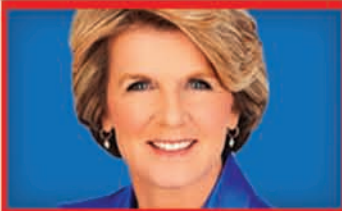
Julie Bishop Foreign Affairs

Nationals leaders has represented the seat of Wide Bay in southern Queensland since 1990. Is known for being quietly spoken and shunning the limelight. Was Minister for Trade in the Howard Government.