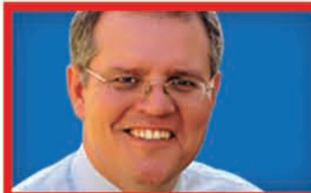
Scott Morrison Immigration and Border Protection